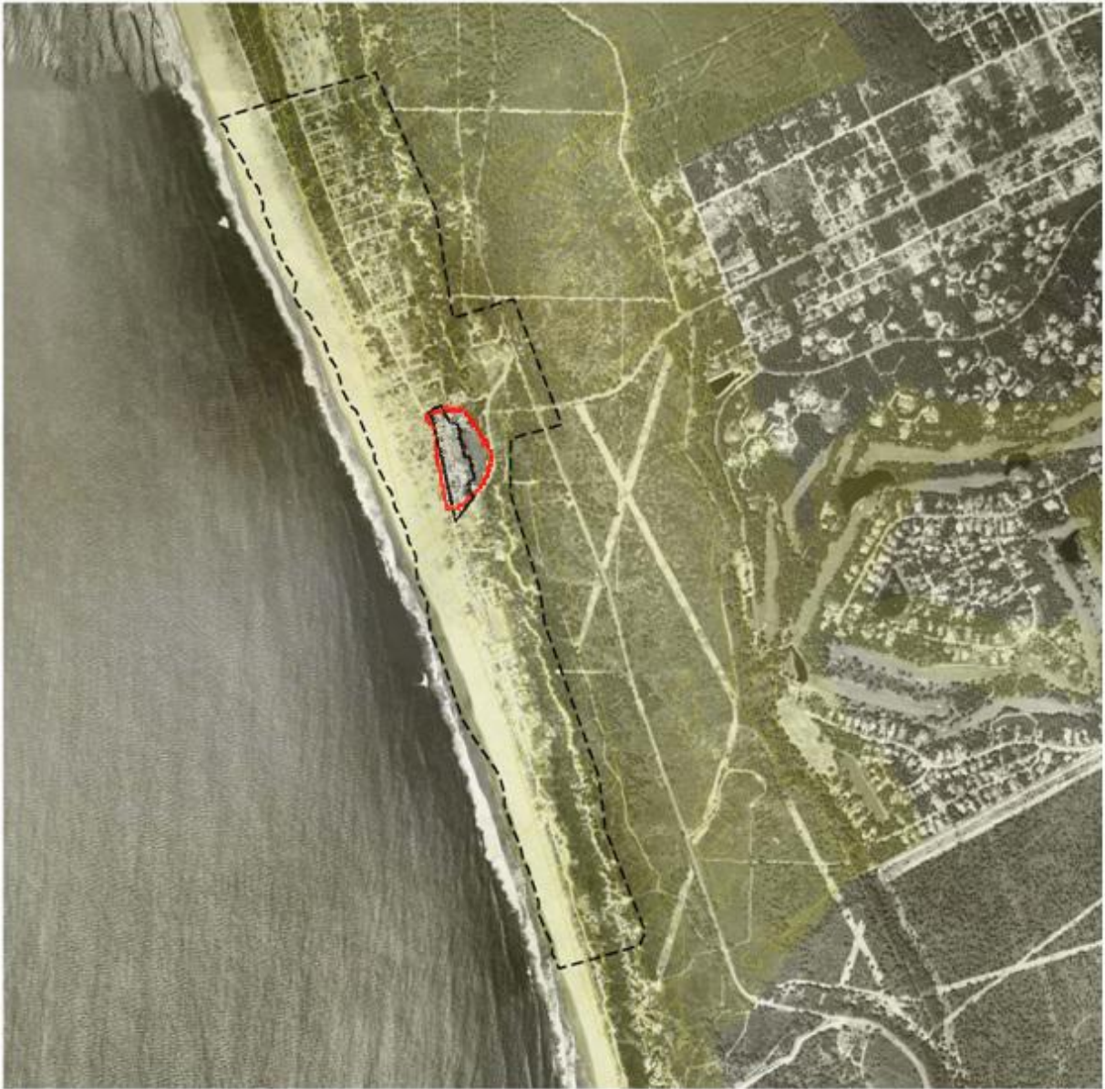
Imagem 01_REN segundo PDMA, limites do PPFT e perímetro habitacional proposto